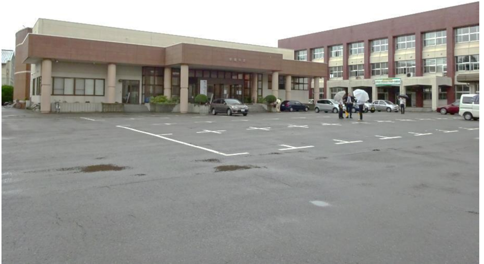
鶴翔会館と本校舎