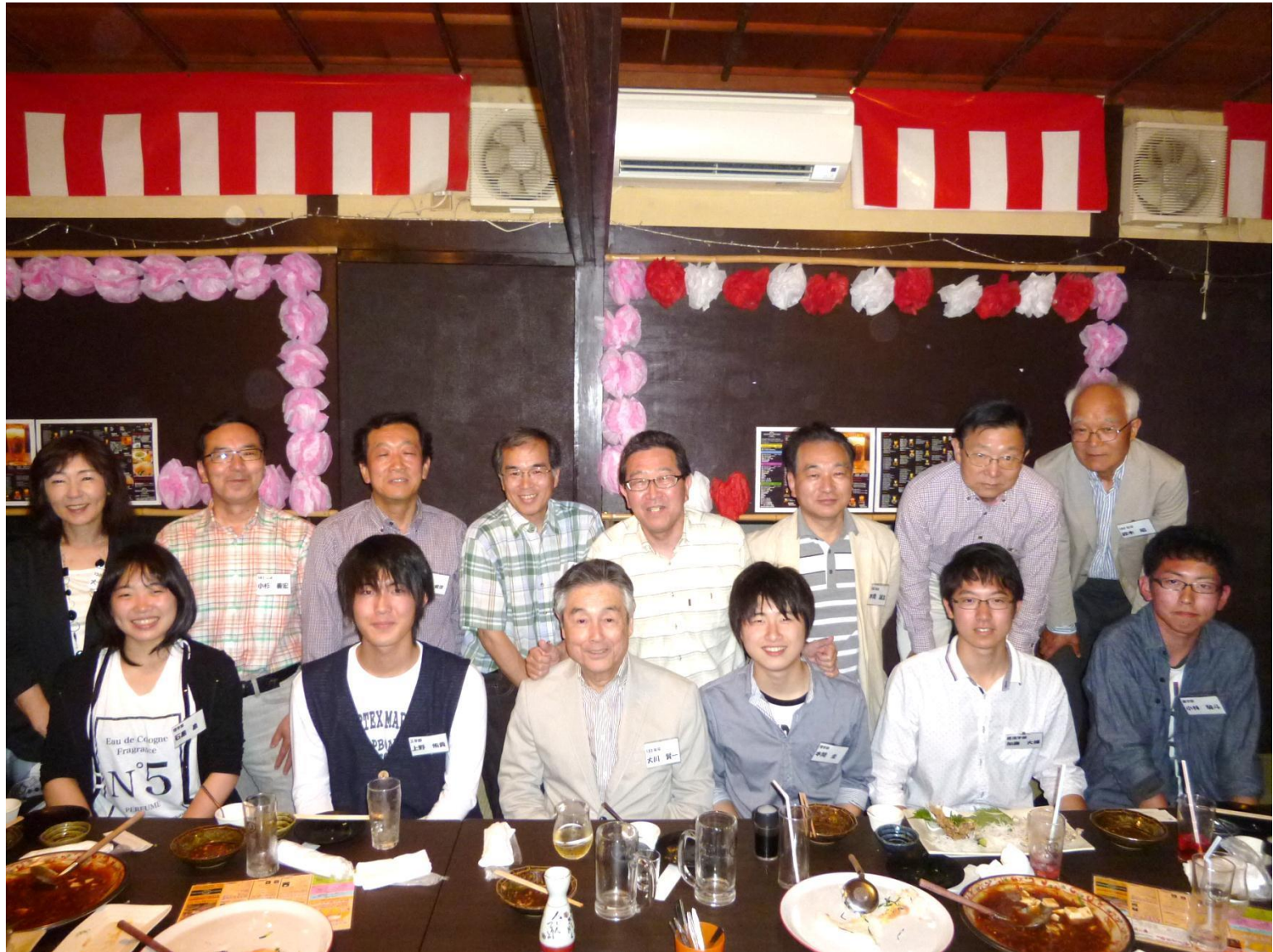
平成26年6月14日 鶴翔同窓会新潟支部新入生歓迎会 君んちキッチン