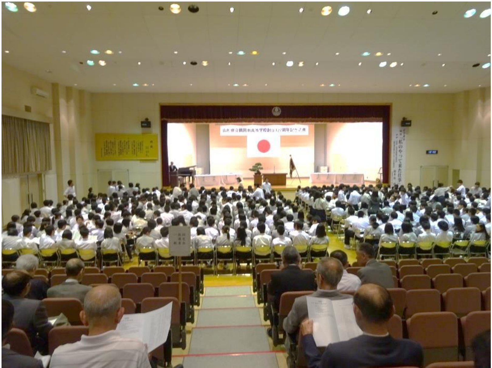
会館内部と記念式典