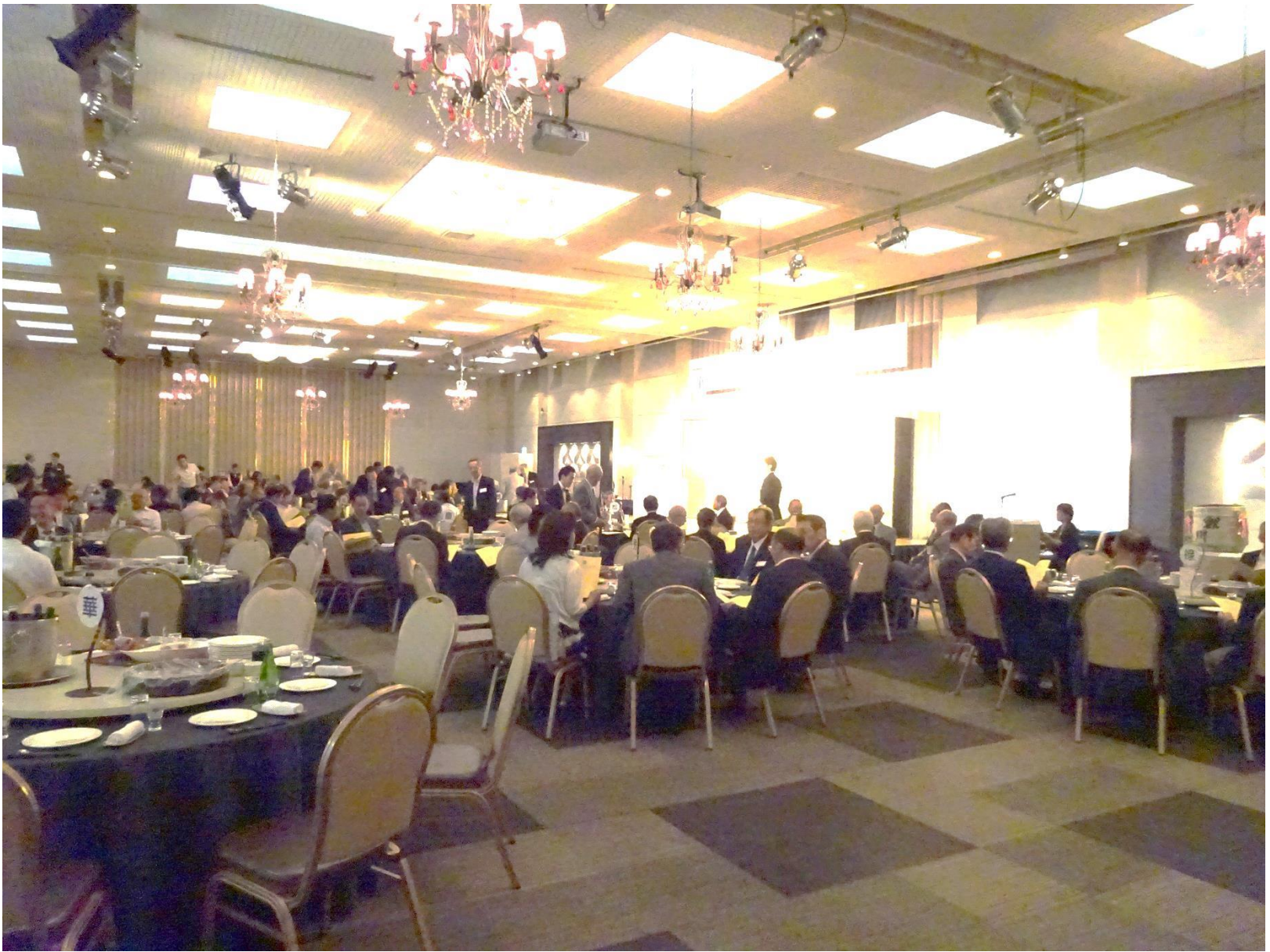
記念祝賀会 グランドエルサン