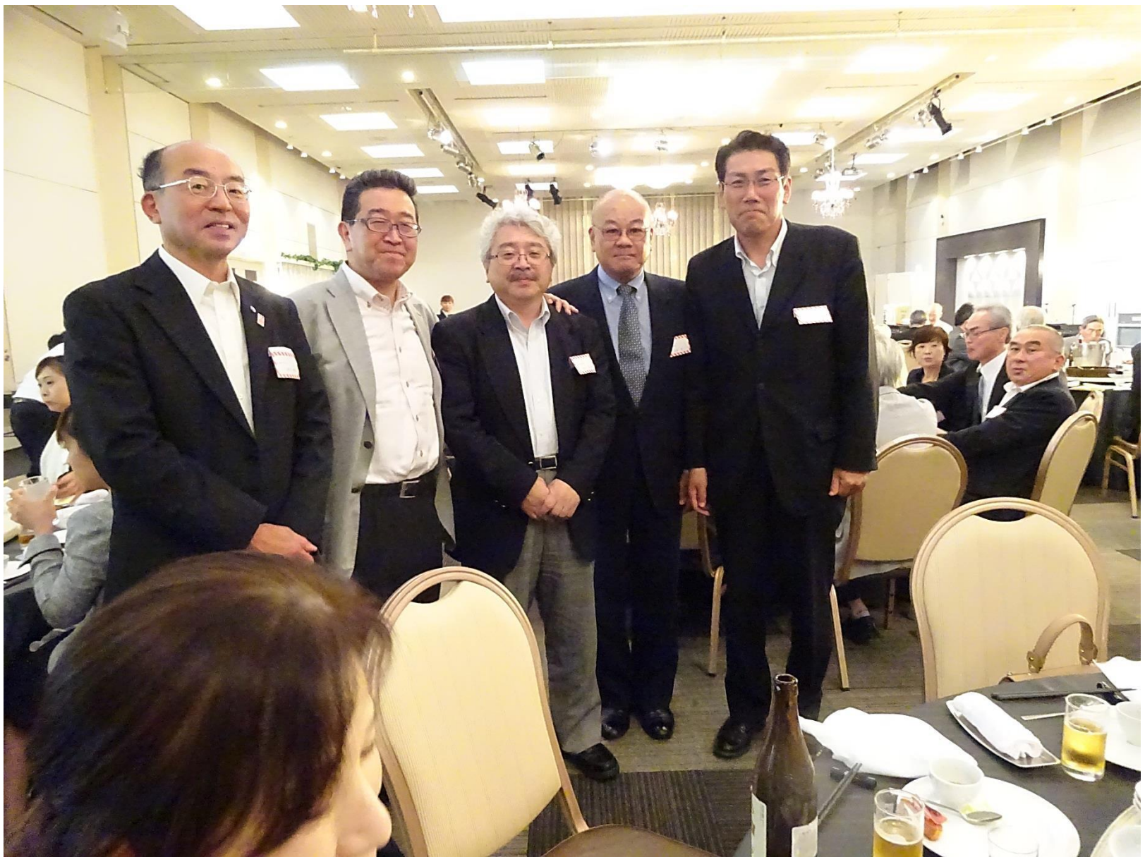
記念講演演者を囲んで(昭和50年卒 3年2組)