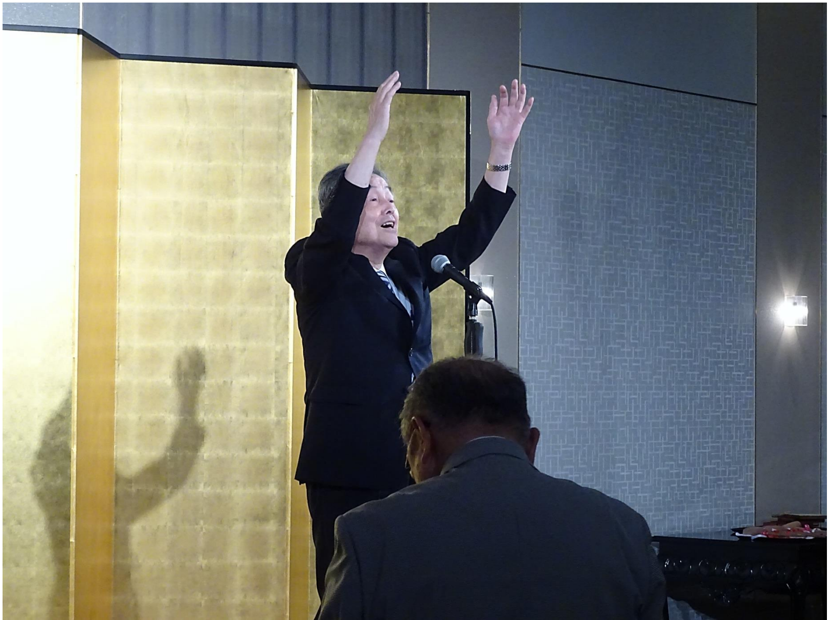
大川先生による万歳三唱