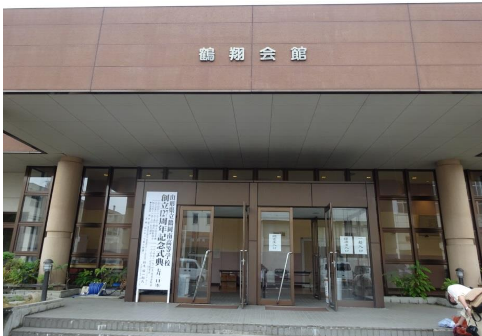
鶴翔会館 正面玄関